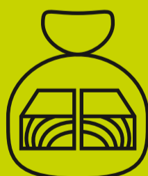
Eraldi (kilekotti, big-bagi vms) pakendatud töödeldud puidujäätmed