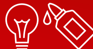
Ohtlikud jäätmed (s.h. asbesti sisaldavaid isolatsiooni- ja eterniidijäätmed, ohtlike jäätmetega saastunud pakendid ja puhatuskaltsud, luminofoolambid)