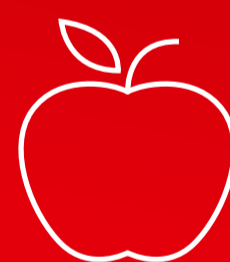
Biolagunevad toidu- ja aia- ning haljastus jäätmed