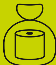
Eraldi (kilekotti, big-bagi vms) pakendatud soojustusvilla jäätmed