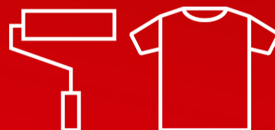
Olmejäätmed (s.h. kasutatud riided ja jalanõud)